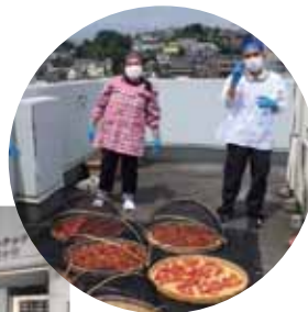
（有）ウエルテックむらさき