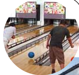
NPO 法人 ふれんど45