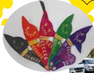
NPO 法人 きてん